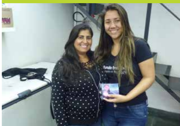
Equipe do Fundo Brasil entrega produtos a lojistas parceiras no programa Nota Fiscal Paulista

23 DE SETEMBRO É DIA PARA LEMBRAR: A EXPLORAÇÃO SEXUAL E O TRÁFICO DE PESSOAS NÃO ESTÃO NO SEU ÚLTIMO DIA.