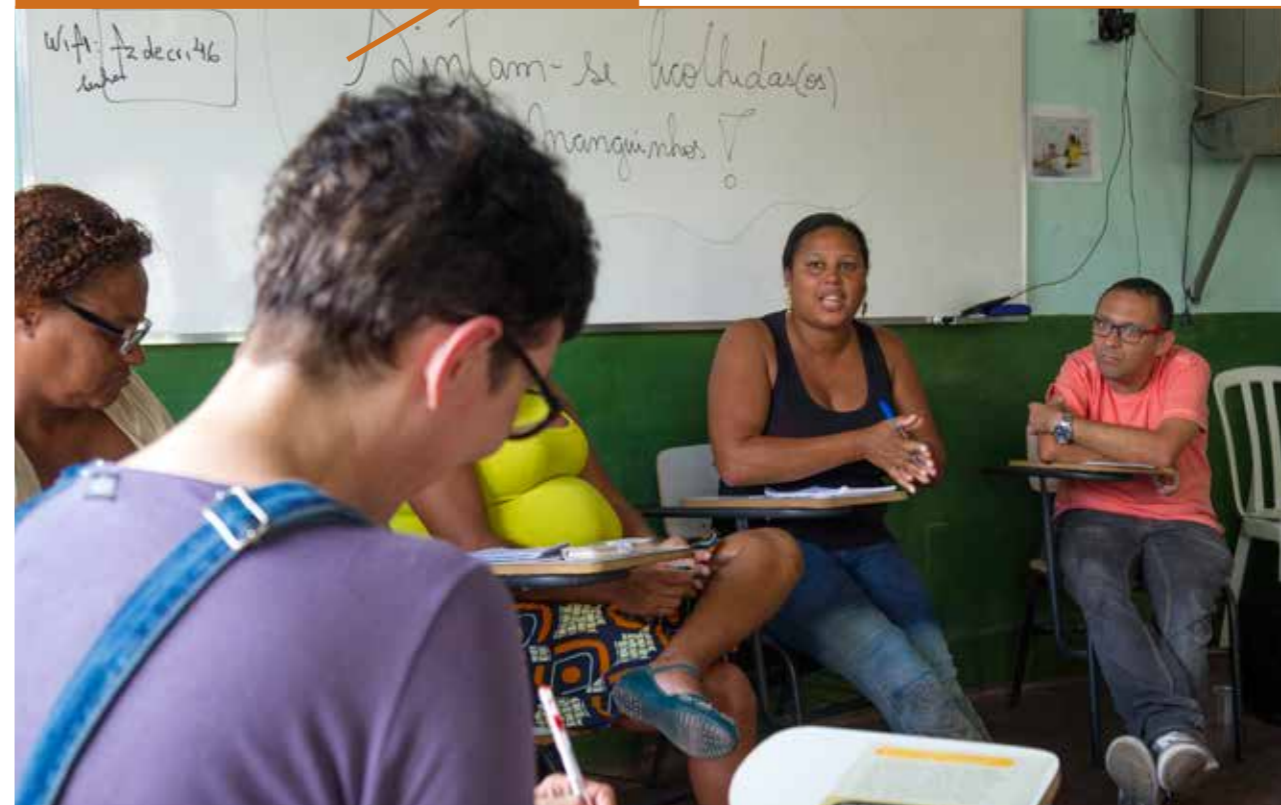
Roda de conversa com troca de experiências de ativistas no Rio de Janeiro