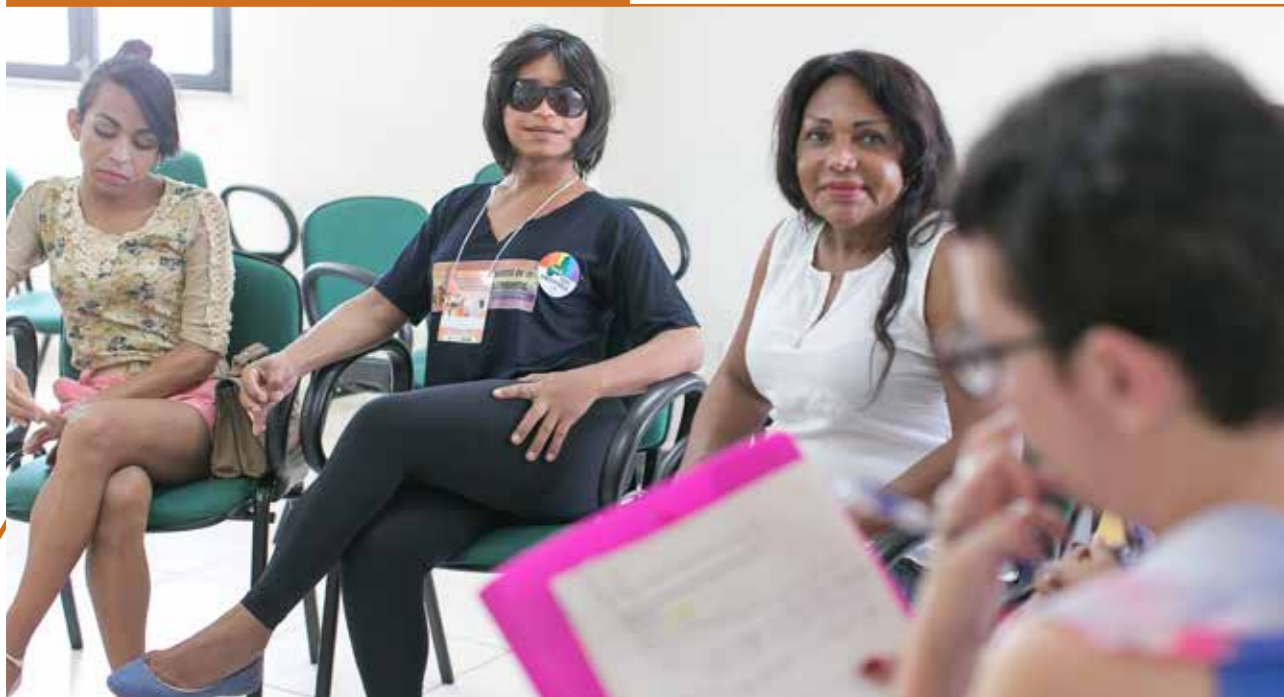
Monitoramento ao GPTrans, em setembro de 2015, em Teresina, no Piauí