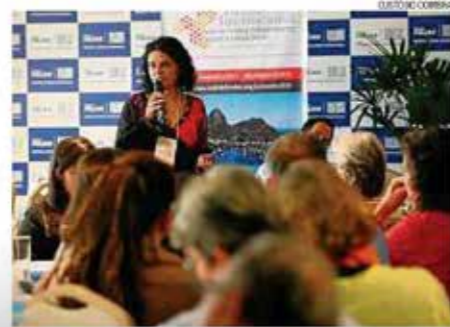
Na origem. Ana: filantropia de justiça social trabalha na raiz dos problemas

— O encontro quer também dar visibilidade para o trabalho dos Fundos Independentes e mostrar como estes representam e influenciam uma nova cultura filantrópica no Brasil — explica a coordenadora