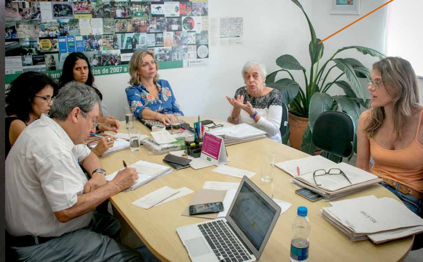
Reunião do processo de seleção de projetos apoiados por meio da nova iniciativa